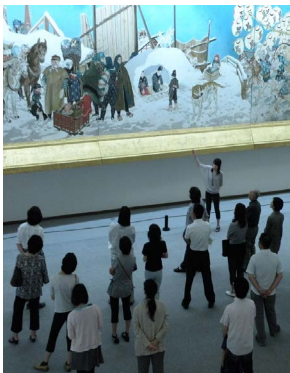
定例ギャラリートーク 《秋田の行事》を読み解く